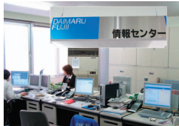
【情報センターでワークフローを開発】

横濱氏 「たった14種類ですが、1年間に2万9千枚もの帳票が使われています。支店、出張所なども含めて全社員、約750台のクライ