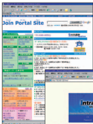
【ポータルサイトのトップページ】

佐々木氏 「ワークフローエディタも導入し、自社で開発している狙いはいくつかあります。ひとつは、自社の業務フローにピッタリと合ったオーダーメイドのものを作りたい、という点です。創業113年と歴史の古い会社ですから、いろいろな点で独自の流儀があります。例えば、