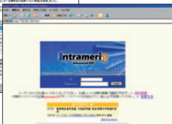
【ワークフローのトップページ】